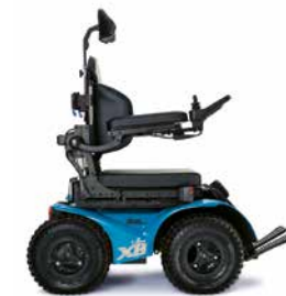
AZUL - JANTES NEGRAS