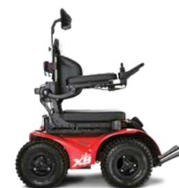
VERMELHO - JANTES NEGRAS