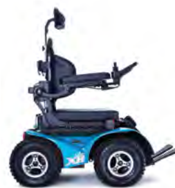
BLAU - SCHWARZE FELGEN