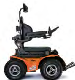
ORANGE - SCHWARZE FELGEN

“WIR STELLEN SEIT 25 JAHREN KUNDENSPEZIFISCH ANGEFERTIGTE ROLLSTÜHLE HER, DAMIT SIE SO LEBEN WIE SIE WOLLEN”