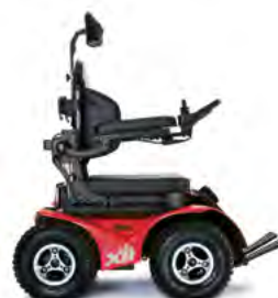
ROT - SCHWARZE FELGEN