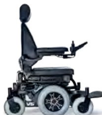
V6 HYBRID - GRAU RÄDER