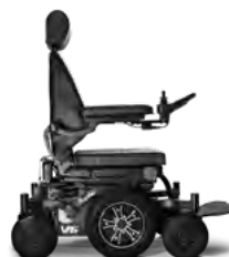
V6 HYBRID - SCHWARZ RÄDER