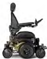
V6 ALL TERRAIN - SCHWARZ FELGEN